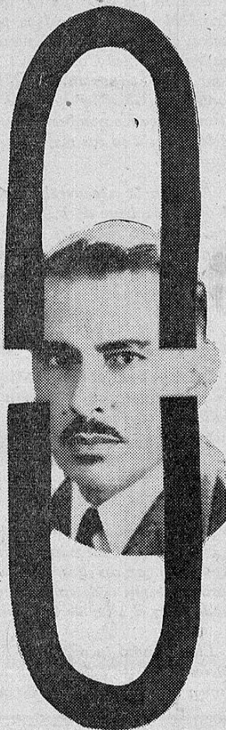
O larga y negra partida...